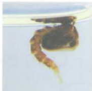
Pupa del mosquit tigre.

El mosquit tigre ( Aedes albopictus ) és originari del Sud-est asiàtic. L'estiu de 2004 es va detectar per primera vegada a Catalunya.