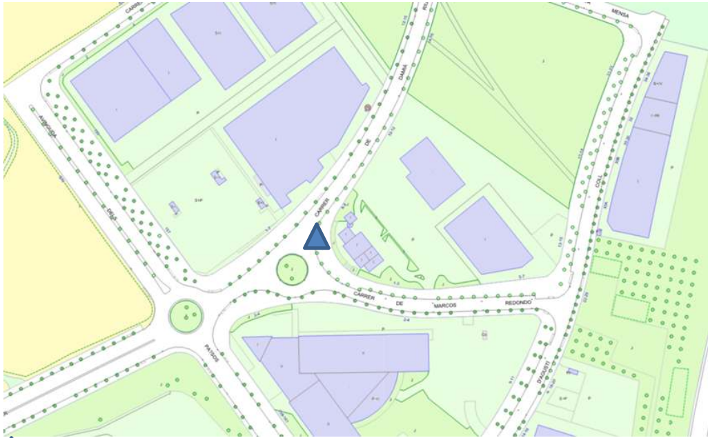
▲ Els Trullols