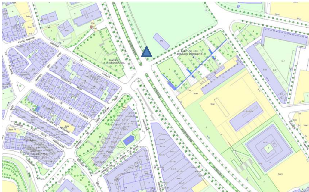
▲ Zona Universitària