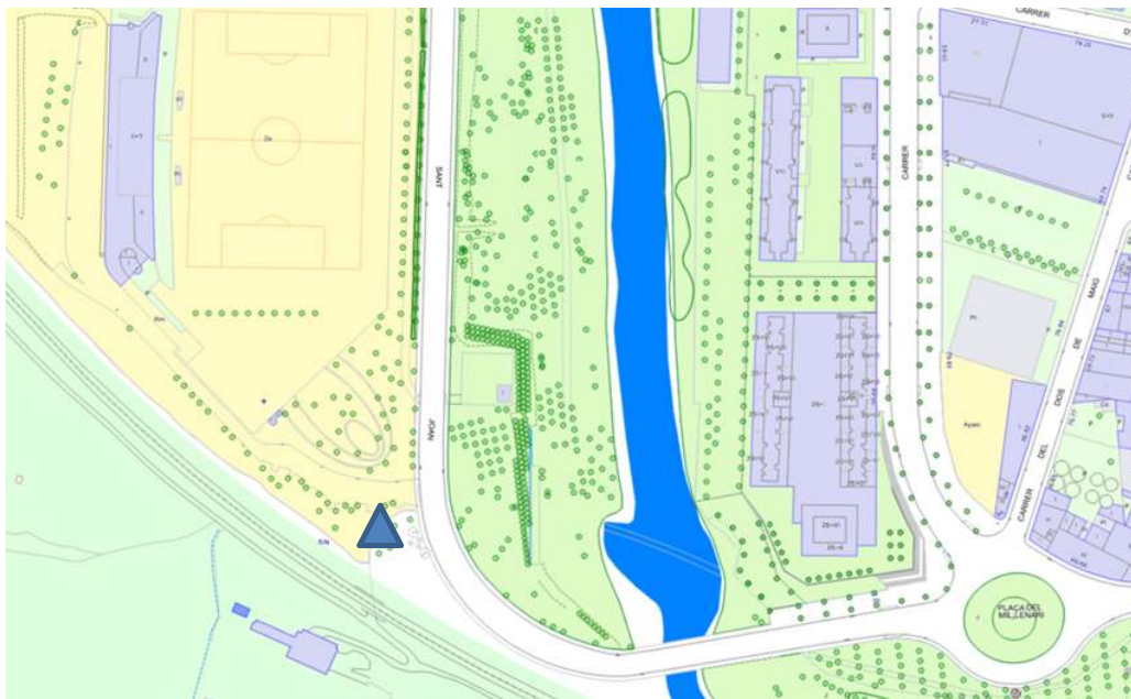
▲ El Congost