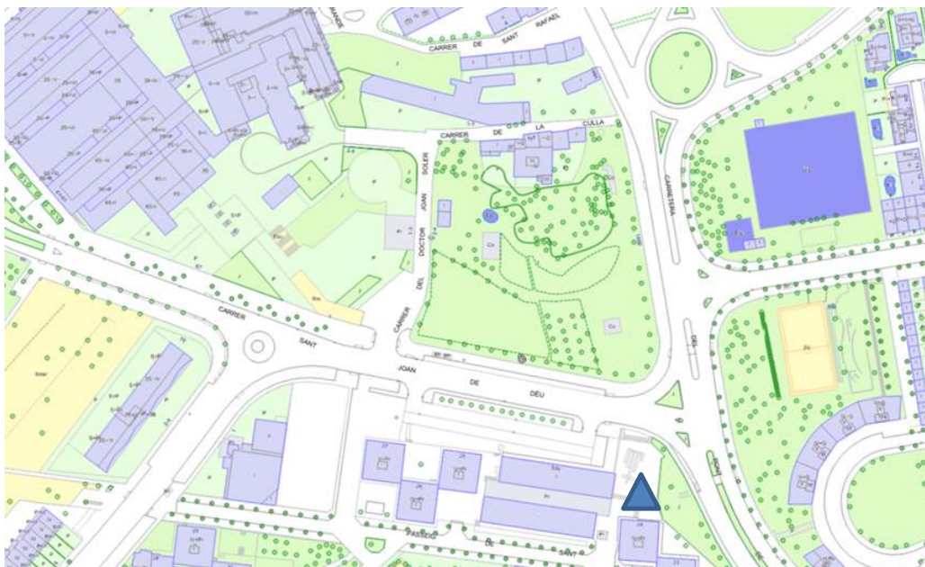
▲ Hospital General