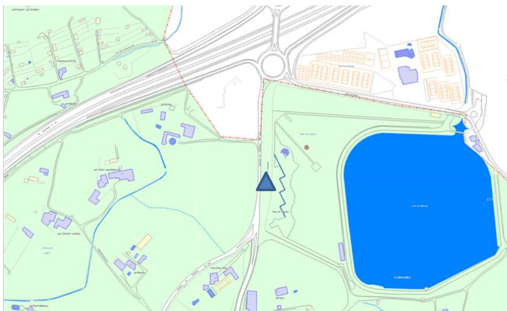
▲ Parc de l'Agulla