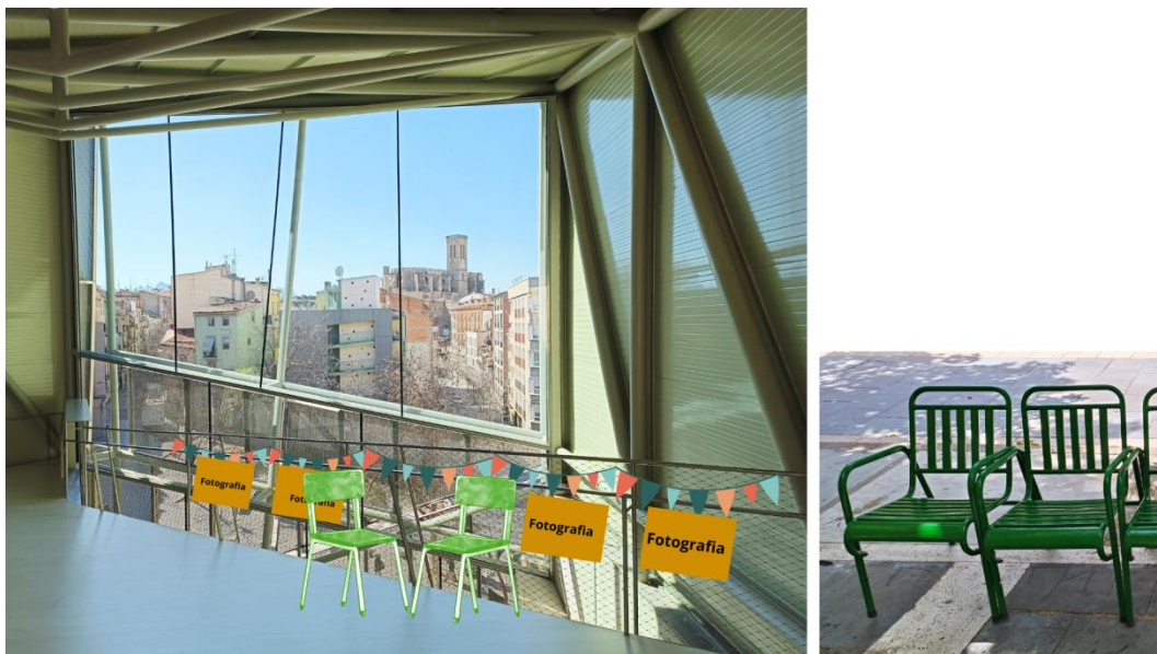
El mirador del Museu del Barroc de Catalunya i les cadires de la Rosita.

Per contextualitzar l'acció amb una peça artística, el mirador comptarà amb una instal·lació efímera constituïda per unes fotografies històriques de la ciutat envoltades de dues cadires icòniques de Manresa: les cadires de la Rosita. Aquestes cadires representen el concepte de prendre la fresca i d'observació de la vida quotidiana. En aquesta dinàmica, agafarem el rol de voyeur i parlem sobre com ha evolucionat la trama urbana de Manresa i les localitzacions de procedència dels participants, els espais i tradicions que s'han perdut o mantingut des d'aleshores.