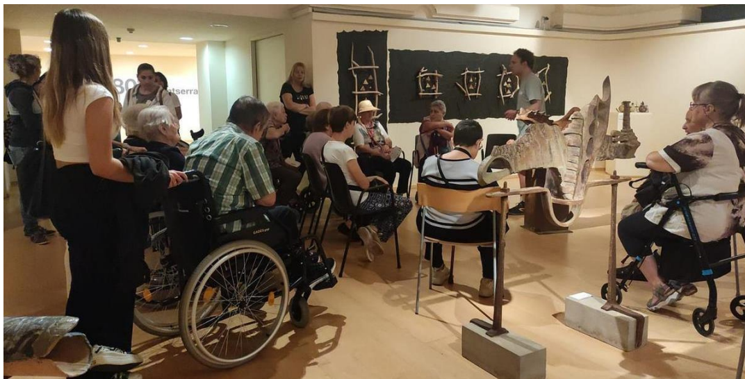
Visita amb tècniques de reminiscència a un grup de persones grans d'una residència de la ciutat a l'exposició Montserrat Riu. 1280º al Centre Cultural El Casino, el novembre de 2023 (Font: Regió7).

La reminiscència, del llatí Reminiscentia , significa l'acció de recordar experiències passades o recordar una cosa quasi oblidada . Les tècniques de reminiscència, doncs, són una eina útil per treballar la memòria, l'estimulació dels records, la relació amb els companys, l'empatia i l'escolta en persones amb demència.