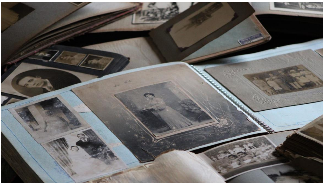
Una idea de disposició de L'Àlbum del Patrimoni a la Fresca

Amb l'àlbum, cada persona gran podrà aportar (amb l'ajuda de les cuidadores i la família) una imatge personal i vivències entorn al tema. L'obra col·lectiva pot itinerar per les habitacions dels centres i deixar-se en préstec a les famílies.