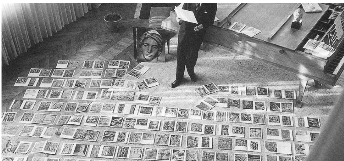
El museu imaginari d'André Malraux

En el Museu de Records us proposem crear aquest 'museu imaginari' creant l'Àlbum del Patrimoni a la Fresca, és a dir: un museu portàtil amb totes aquelles fotografies i records dels grups del centre al voltant de les trobades i festes dels barris i pobles com a llocs d'autoafirmació i identificació col·lectiva.