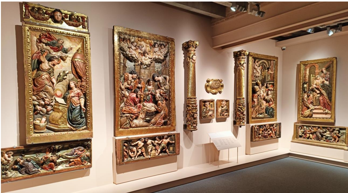
La sala del Concerto de Records

L'activitat es combinarà amb la interpretació de peces musicals en directe, per part de les instrumentistes Berta Sala (piano i veu) i Queralt Valls (violí), que ens transportaran de la música clàssica fins a les músiques dels nostres dies.