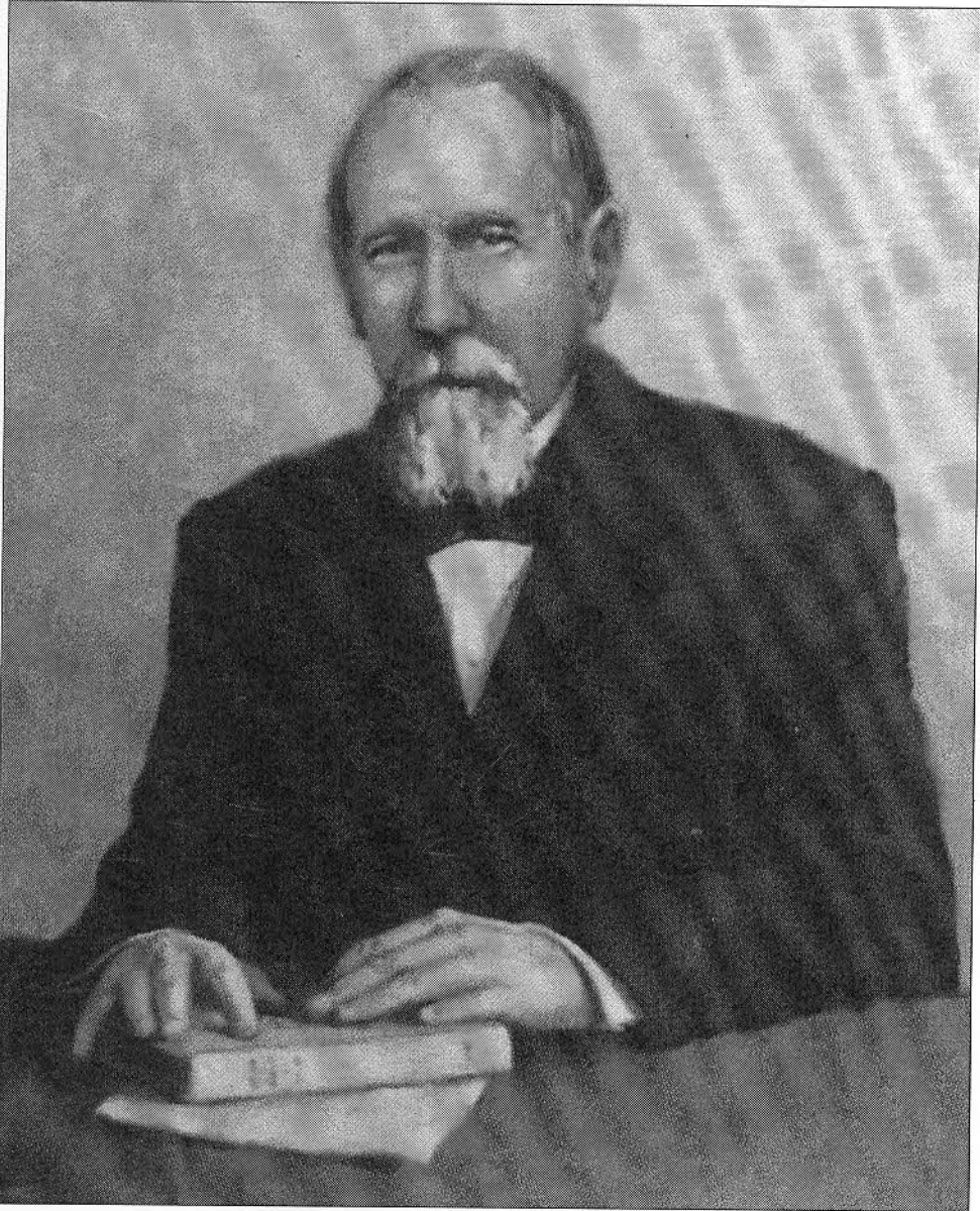
Retrat a la Galeria de Manresans Il·lustres. (pintat per Josep Barés)