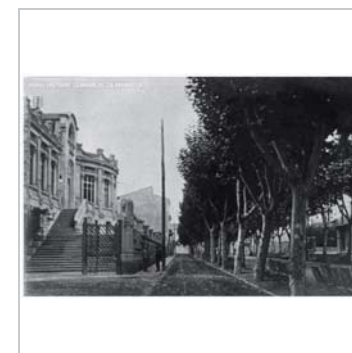
Fotografia històrica 1910-20