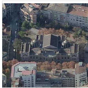
Vista aèria