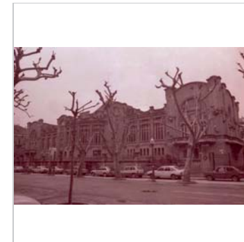
Fotografia històrica 1981 Raquel Lacuesta