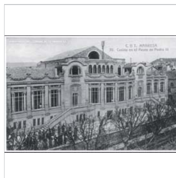
Fotografia històrica 1910-20