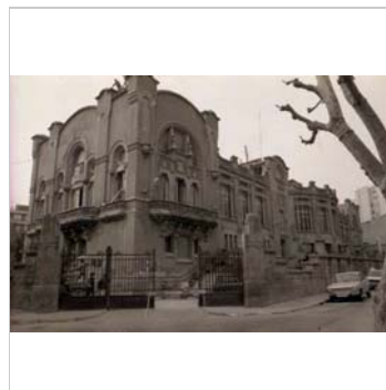
Fotografia històrica 1982 Raquel Lacuesta