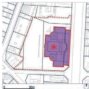
Plànol de localització

Illal/Pol. Parcel·la Titularitat Pública 22040 11 Pública 22040 23 Pública