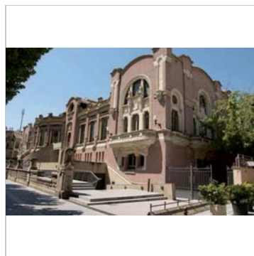
Fotografia del bé