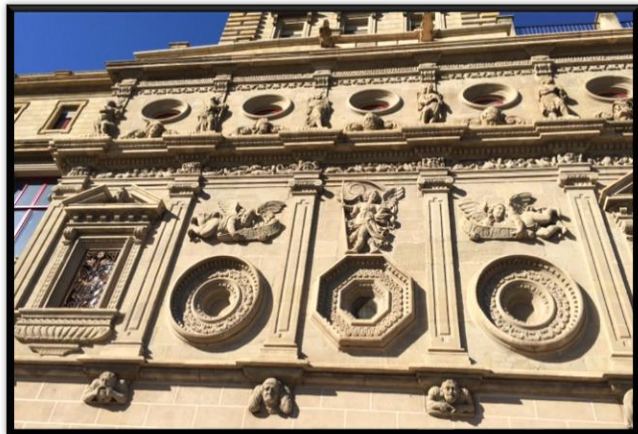
Imatge dels tres òculs centrals de la façana barroca.

Contiguament a l'intercolumni de l'ull de bou octogonal, s'hi troben dos panys de paret decorats amb òculs cecs ornamentats i amb angelets sostenint filacteris que resen la llegenda “COVA DE” i “S. IGNASI”. Aquests envans, a la vegada, limiten amb dos trams