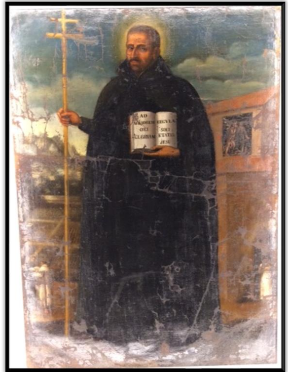
Quadre de Sant Ignasi encarregat pels dominics (c.1650). Oli sobre tela. Actualment se'n troba una reproducció exposada a "l'Espai 1522", a la plaça Fius i Palà de la ciutat.

En el quadre, d'oli sobre tela, i que havia sigut comissionat pels dominics a un autor encara desconegut, s'hi representava la figura de Sant Ignasi amb quatre escenes laterals on es definien els fets més importants de l'estada d'Ignasi al convent de Sant Pere Màrtir. El