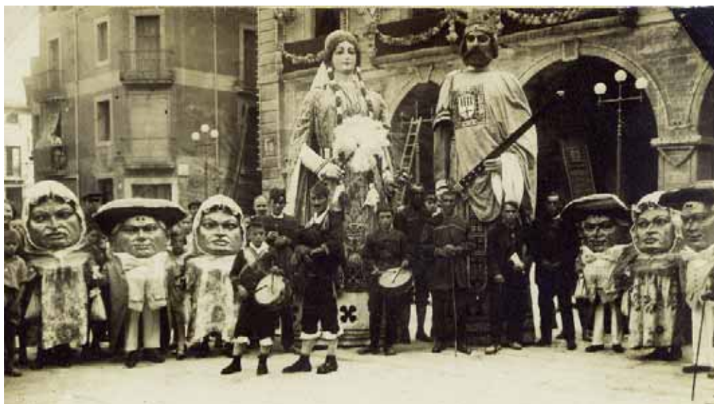
Gegants, nans, portadors i músics, abans de la Guerra Civil.