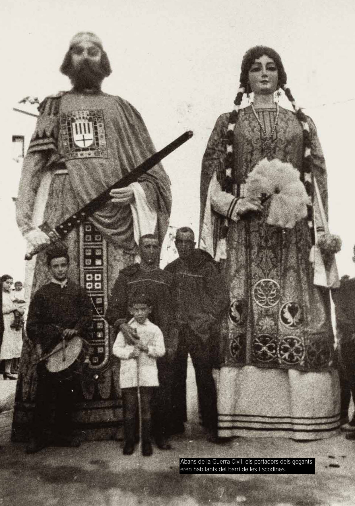
Abans de la Guerra Civil, els portadors dels gegants eren habitants del barri de les Escodines.