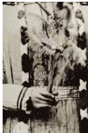
Detalls del pergami i del ram que duïen els gegants vells.