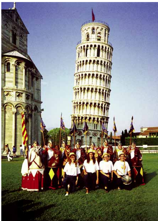
Els cavallets a la ciutat italiana de Pisa.

Malgrat que l'actuació dels cavallets de Manresa era prevista per a les festes manresanes (com la resta d'entremesos), l'originalitat de la comparsa i el caire de les seves intervencions han fet que es traslladés a altres indrets. La comparsa porta més d'un centenar d'actuacions arreu del país i també fora del país, com, per exemple, Perpinyà, Tolosa, Andorra, Brusselles, París, Zuric, Saragossa i un llarg etcètera gairebé inacabable.