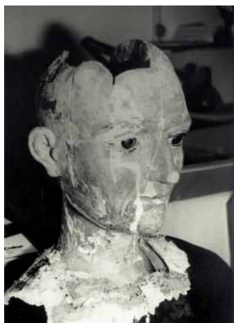
El cap del gegant vell durant la seva restauració.

3ª Por el trabajo de baylar los Gigantes en el día de Corpus y Cap de Octava ..... 6 lliures, 18 sous, 9 diners