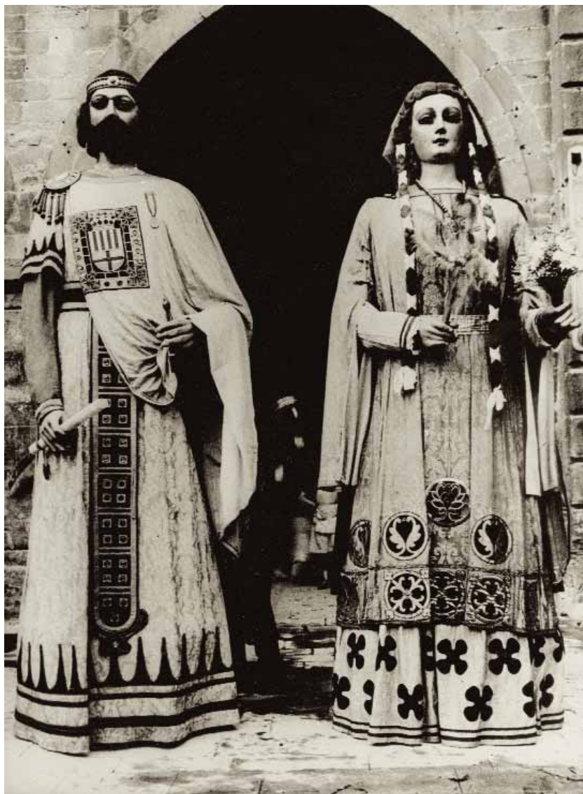
Els gegants en una imatge posterior a 1926.

L'any 1768 els gegants obtenen un reconeixement públic de cabdal importància, pel que es desprèn de l'acta de la reunió del Ple municipal dut a terme poc abans de l'arribada de la festivitat del Corpus. Re llegint aquesta acta, conjecturem que els gegants s'havien tornat im-