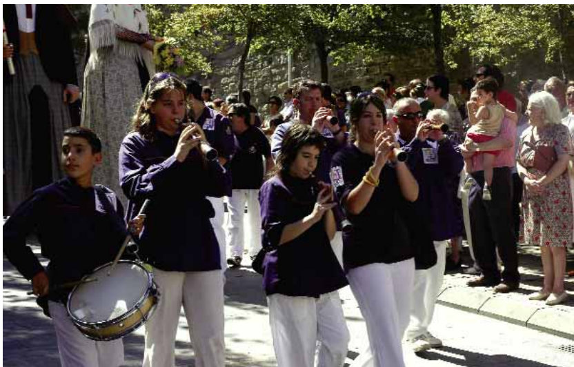
La colla de grallers acompanya gegants i nans en seguicis i cercaviles.

Algunes d'aquestes músiques manresanes, ja tradicionals, s'han utilitzat durant molts anys. D'altres, si bé són d'autor, s'han anat incorporant als diferents esdeveniments i han esdevingut ja tradicionals, formant totes elles un sol "corpus" amb la imatgeria manresana.