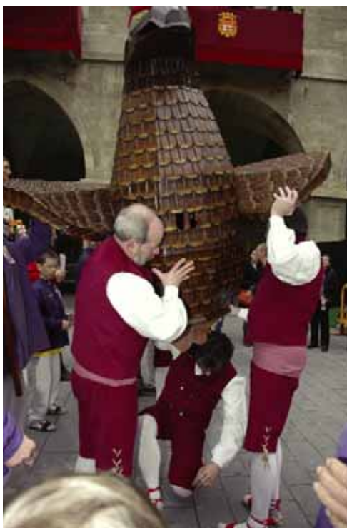
La colla dels geganters s'encarrega de dur les figures dels gegants, els nans i l'àliga.