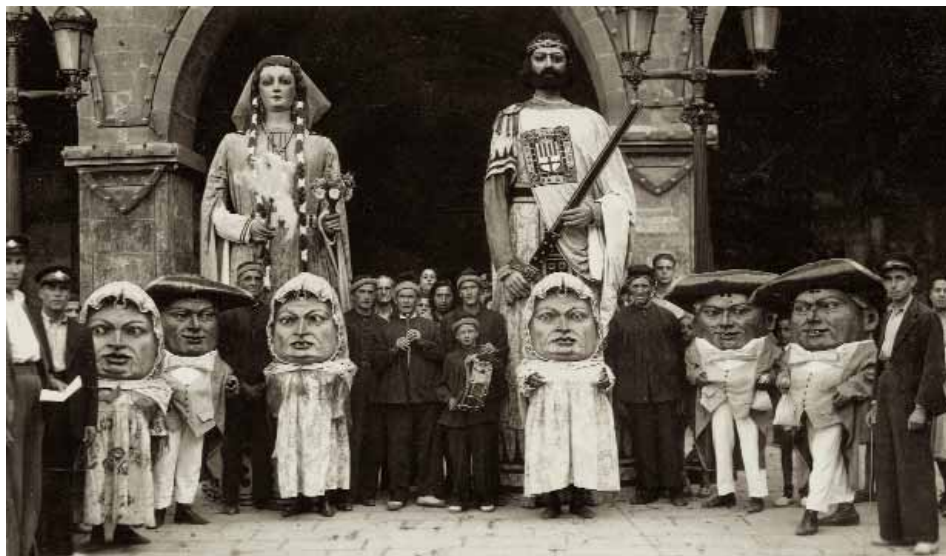
Gegants i nans en una fotografia dels anys quaranta del segle XX.