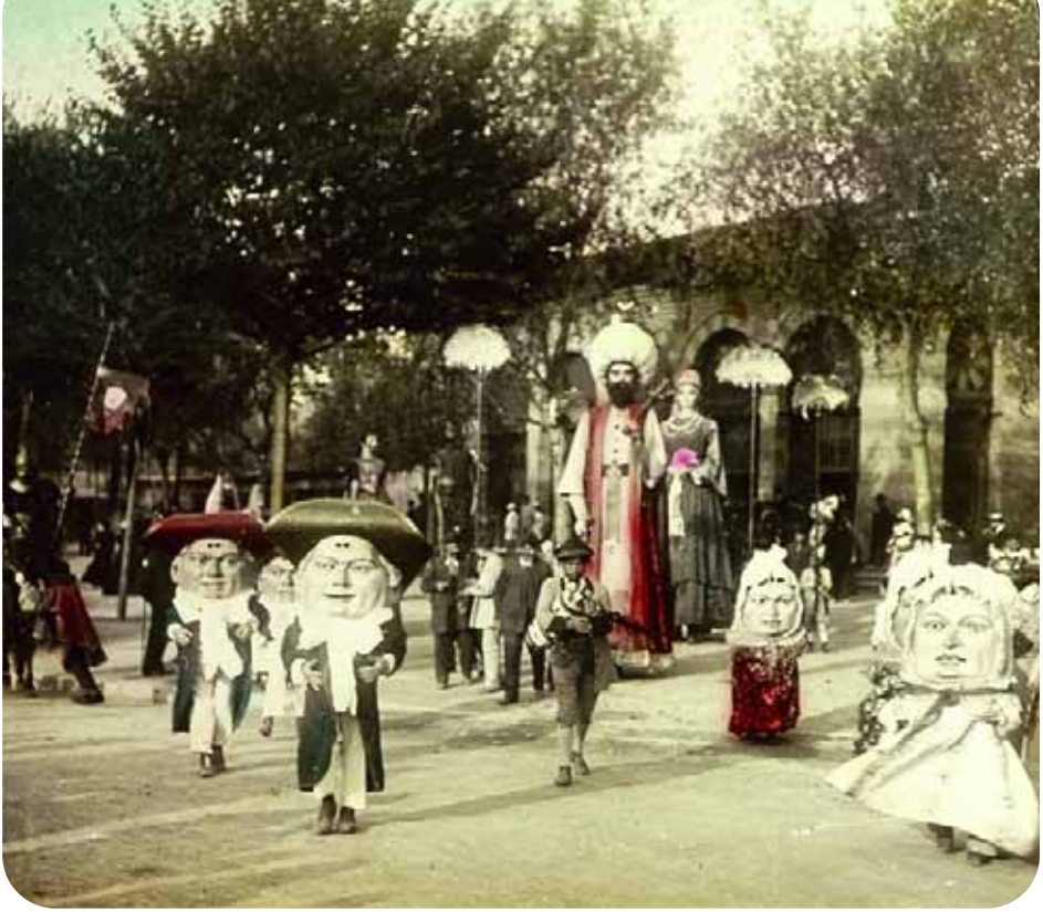
Imatge dels gegants i nans de Manresa a Barcelona per la Mercè de 1902.