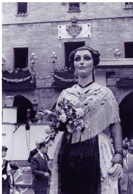
Imatges de la festa de bateig de la Pubilla.