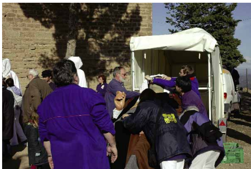
Els geganters, amb l'Hereu, en una de les sortides que formen part del protocol de la ciutat.