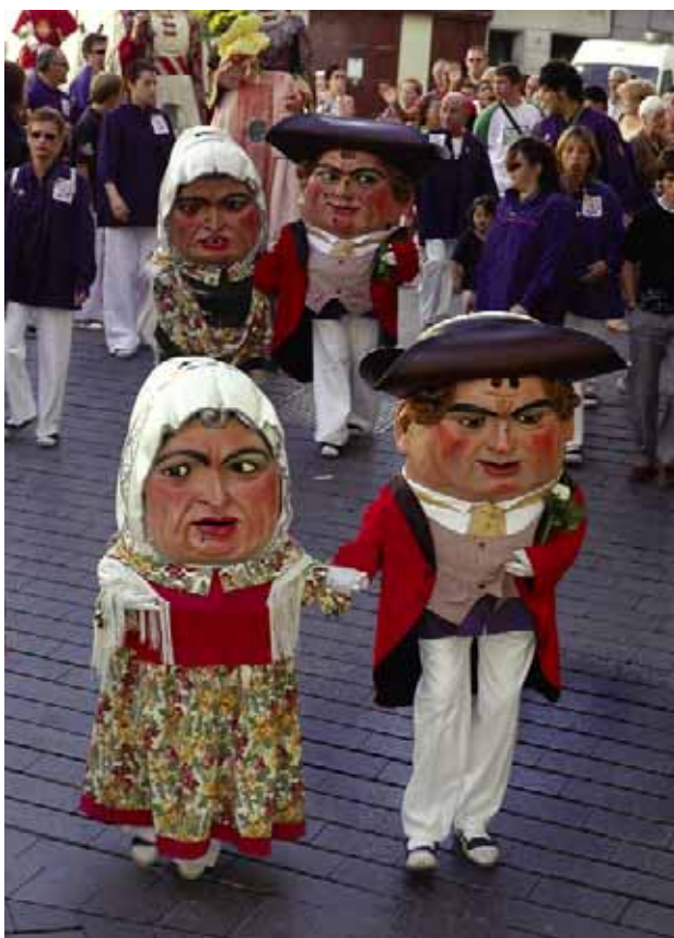
Els nans renovats l'any 2002.