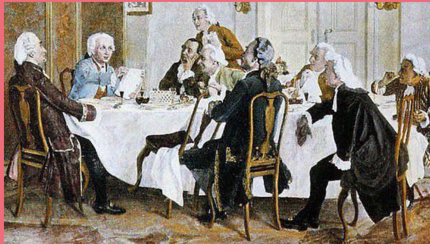
La sobretaula de Kant

Organització: Institut d'Estudis Catalans - Secció de Filosofia, Edicions Universitat de Barcelona, Grup de Professorat de Filosofia de la Catalunya Central i Òmnium Bages-Moianès