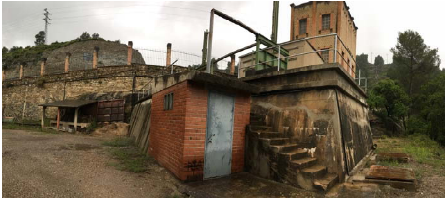
Transformador, comportes, distribució i grup hidràulic

El 28 de juliol de 2017, des de l'Ajuntament es va incoar l'expedient administratiu de protecció de la legalitat i es va requerir la sol·licitud de títol administratiu habilitant que en aquest cas quedava subjecte a l'aprovació d'un projecte d'actuació específica d'interès públic en sòl no urbanitzable.