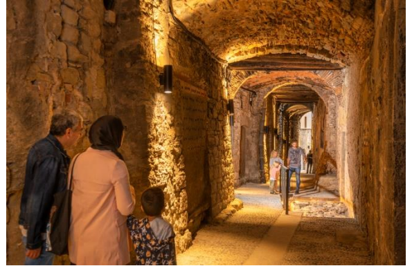
El Carrer del Balç

Un viatge en el temps a la Manresa medieval. Aquest carrer conserva l'essència d'un carrer medieval, com els que va poder conèixer Sant Ignasi de Loiola durant la seva estada a la ciutat l'any 1522.