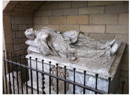
El Sepulcre del Canonge Mulet

És una escultura de marbre de l'escultor manresà Josep Sunyer. Es va cremar l'any 2012 i l'any 2014 es va restaurar.