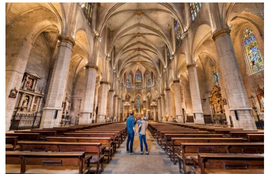
Inetrior de la Seu

Són taulells de diferents materials on hi ha representades escenes religioses i se situen a darrere l'altar.