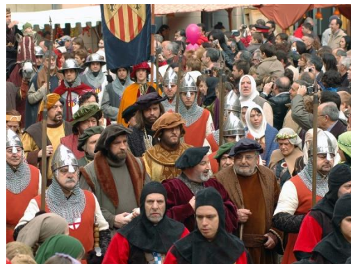
Fira de l'Aixada