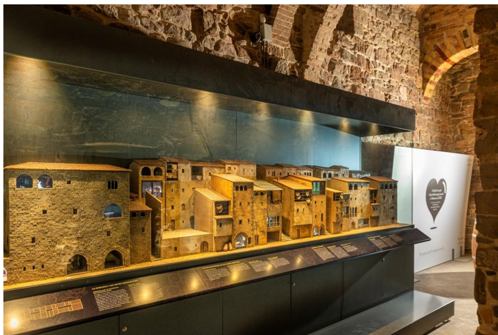
Maqueta del carrer del Balç

És un joc de pistes i enigmes que es fa en equip per resoldre un misteri i sortir d'un lloc.