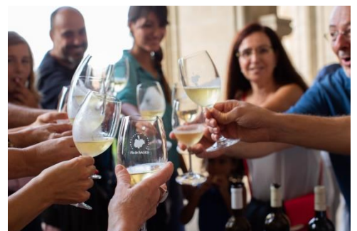
Cata de vins