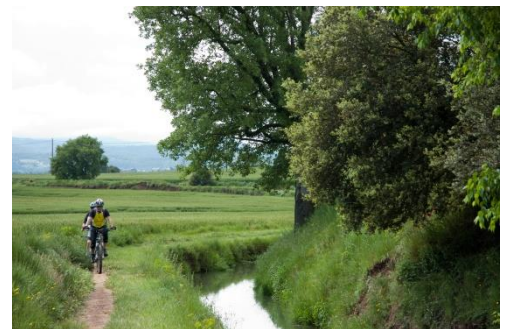
Ciclista a la sèquia

És un esport que es realitza caminant, a un ritme constant i amb bastons.