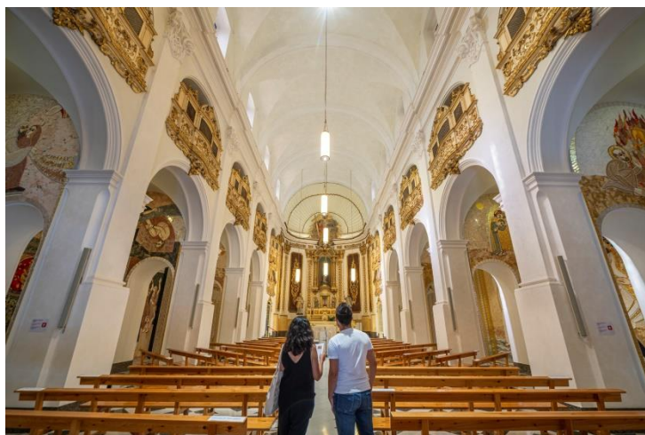
Interior de la Cova

Per més informació i reserves entra a la pàgina web de www.manresaturisme.cat