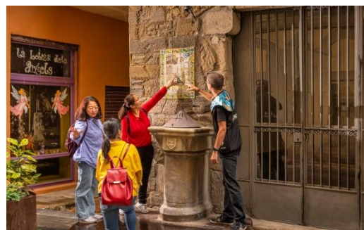
Pou de la Gallina