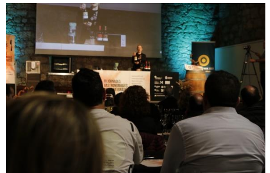
Jornades Gastronòmiques del Camí Ignasià

Esdeveniment relacionat amb el tast del menjar de la zona.