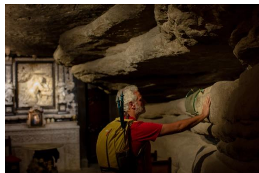
Interior de la Cova

És un art que sovint es relaciona amb l'església i que es caracteritza per ser molt emocional i molt decoratiu.