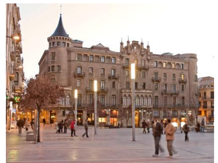
La Buresa, un edifici modernista

És un estil de construcció que busca innovar, ser original i acabar amb l'estil de construcció tradicional.