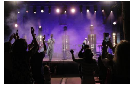
Sons del Camí

Manresa ofereix opcions per a tots els gustos i edats, fent que visitar la ciutat sigui sempre il·lusionant.