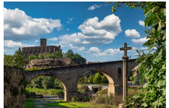
La Seu i el Pont Vell

Va ser una època entre el segle 5 i el segle 15 que destacava perquè es van construir molts castells, també destacava la vida rural, l'art religiós i les guerres reials.