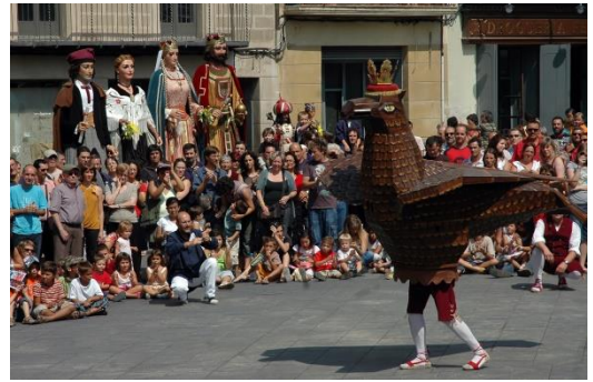
Festa Major de Manresa