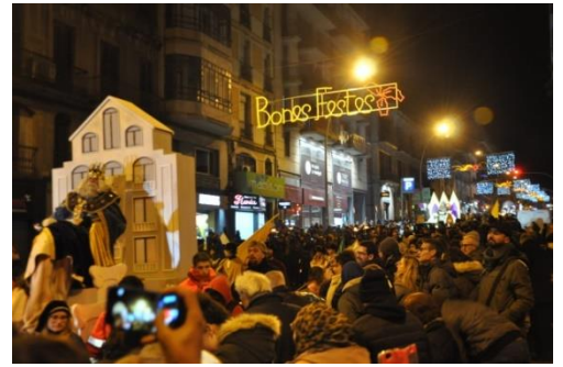
Cavalcada de Reis