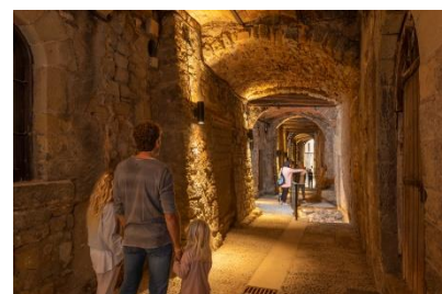
Carrer del Balç