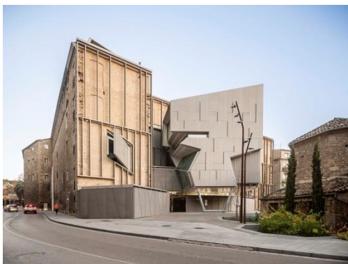
Museu del Barroc