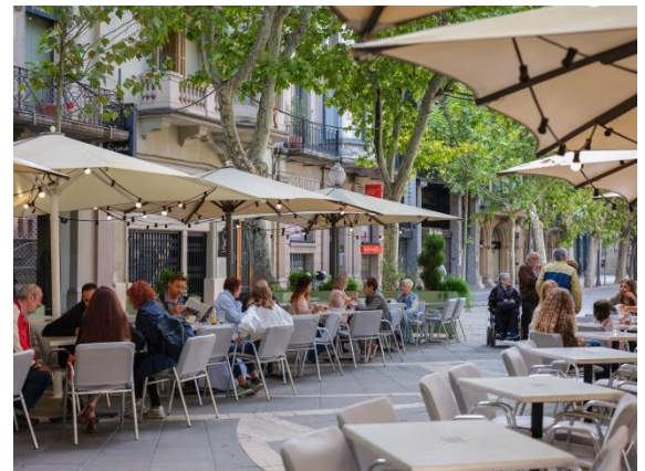
Paseig Pere III

Es refereix a una zona comercial molt gran que té molta varietat de botigues, diferents serveis i restaurants. També quan el centre comercial té una arquitectura diferent i important.