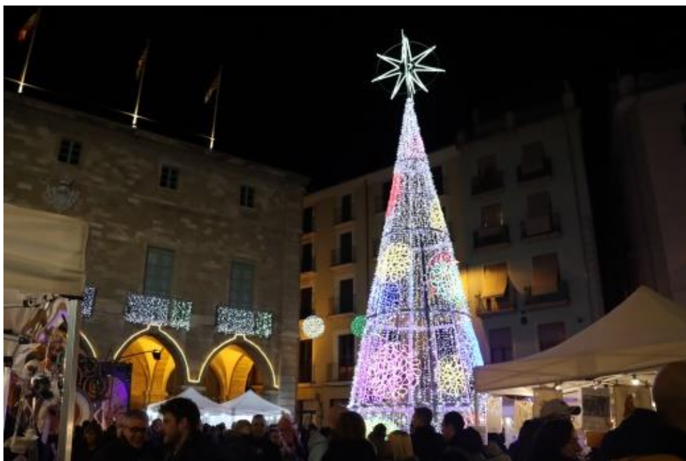
Fira de Santa Llúcia