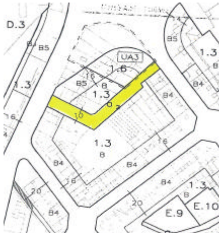
Pla general aprovat 23 de maig de 1997

moment ha constituït un passatge de caràcter privat, sinó que en tot moment ha format part de la xarxa viària pública.