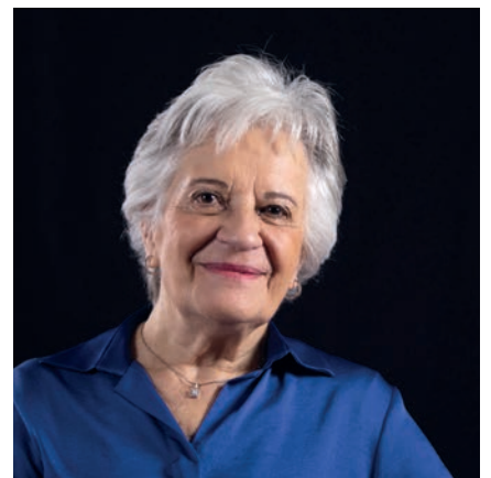
Victòria Camps Cervera

Els cicles Pessics són organitzats pel Grup de Professorat de Filosofia de la Catalunya Central, la Demarcació Comarques Centrals del Col·legi de Periodistes de Catalunya i Centre Cultural el Casino.