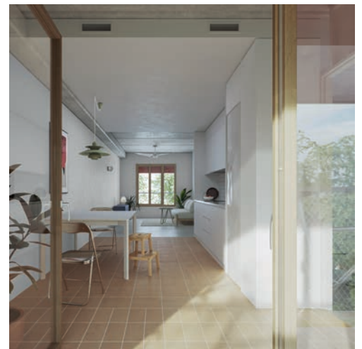
Simulació dels exteriors del nou edifici i també de l'interior d'un dels habitatges