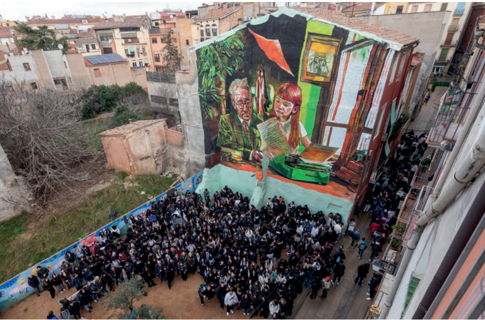
Un gran mural al carrer de la Mel recorda les víctimes de l'Holocaust