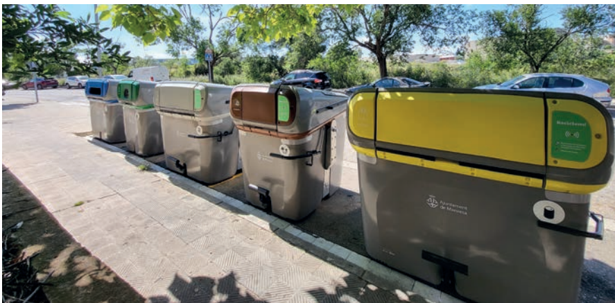
El nou model de contenidors intel·ligents s'ha traduït en més recollida selectiva

El Porta a Porta a comerços i equipaments completa el nou model de residus. Es va començar a implantar el desembre del 2023 i, passat un any, el resultat ha estat positiu. En aquests moments, utilitzen aquest sistema 1.168 comerços i 106 equipaments, que han passat d'un índex de recollida selectiva del 47% a un del 87,4%.