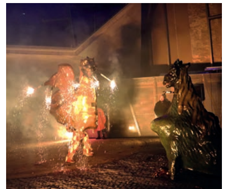
El Museu de Manresa-Museu del Barroc de Catalunya va celebrar l'aniversari amb una jornada de portes obertes, música i les guspises de Xàldiga