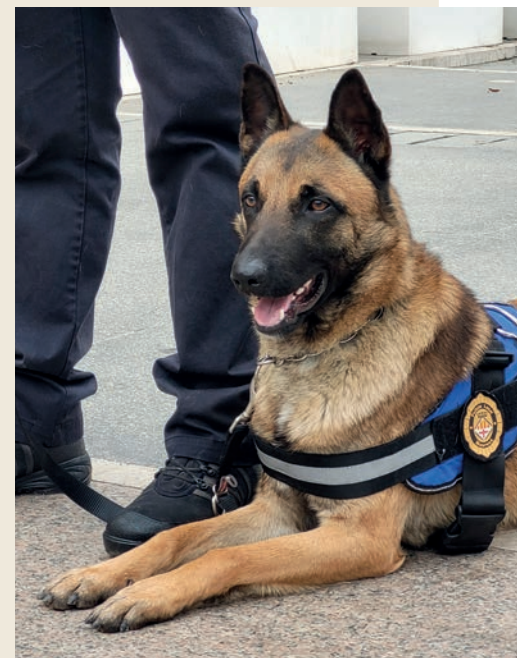
L'Otto és el nou agent caní de la Policia Local de Manresa

La Policia Local de Manresa ha incorporat l'Otto, un gos policia que forma part de la Unitat de Seguretat Ciutadana. Es tracta d'un pastor belga, d'aproximadament un any i mig, que en aquests moments encara està en procés d'ensinistrament. L'objectiu és que pugui acompanyar els agents en el seu patrutllatge a peu de carrer i també en altres actuacions a la ciutat. L'Otto ha arribat a la Policia Local després de ser adoptat per un dels agents del cos manresà que també s'ha dedicat professionalment a l'ensinistrament de gossos. Les qualitats innates detectades en l'animal i el fet que la Policia Local ja tingués present recuperar la figura de l'agent caní, va facilitar la incorporació de l'Otto al cos policia. Amb l'Otto, la Policia Local ha recuperat la figura de l'agent caní, que ja havia estat operativa a finals del segle passat.