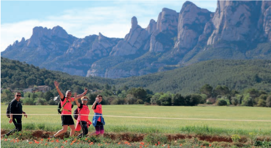
La Marxa del Pelegrí permet gaudir del paisatge i la natura de la comarca