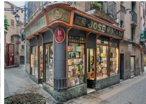
La Casa Torrents i la Llibreria Roca rebran dues de les ajudes per al patrimoni protegit