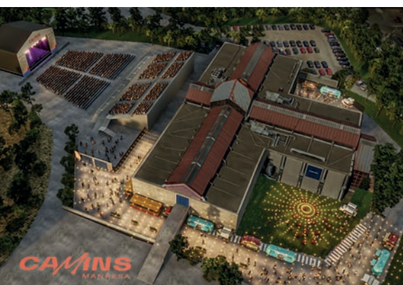
L'exterior del Palau Firal acollirà els escenaris i la zona de restauració i gastronomia del festival

Impulsat per la promotora Promo Arts Music, el festival té el suport de l'Ajuntament de Manresa i de Manresana d'Equipaments Escènics, i compta amb la col·laboració d'entitats esportives, socials, culturals, empresarials i de comerç de la ciutat.