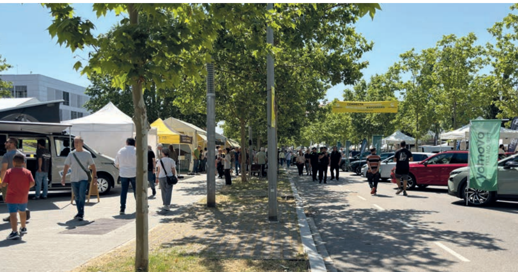
L'avinguda Universitària s'ha consolidat com a ubicació d'ExpoBages