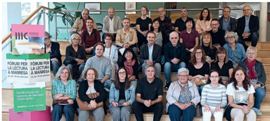
Participants en el Fòrum per la Lectura celebrat a finals de 2025 a Manresa

El Pla, impulsat per l'Ajuntament, compta amb el suport del Departament de Cultura de la Generalitat de Catalunya.