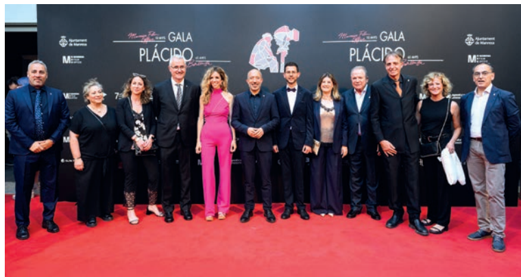
La gala ha comptat amb l'assistència de professionals del sector, representants institucionals i públic en general