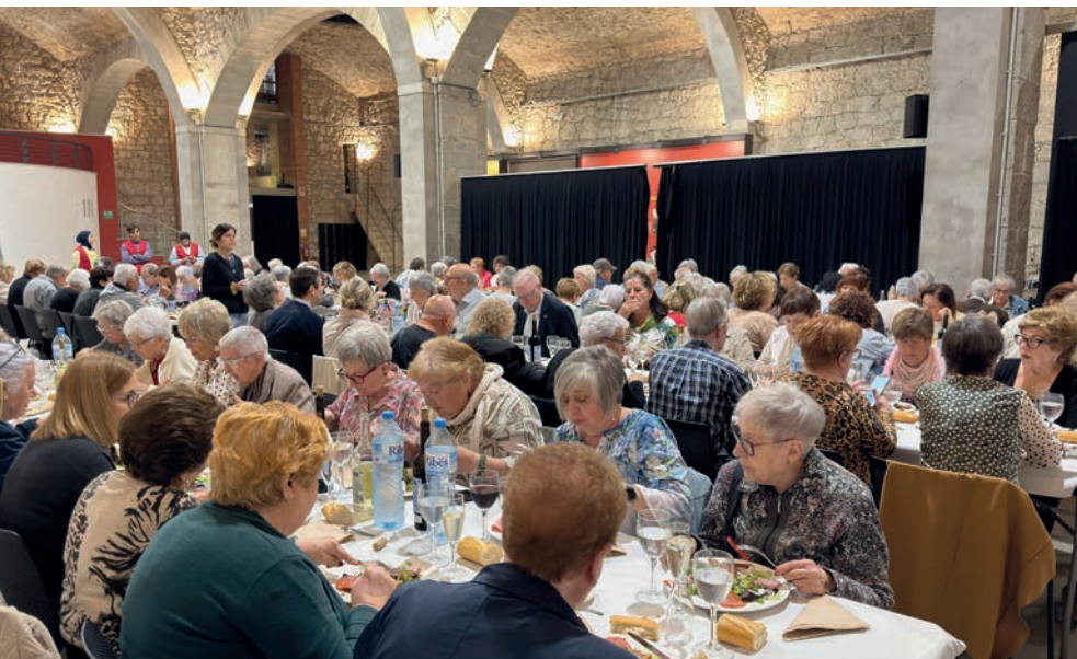
El dinar d'homenatge es va fer al Museu de l'Aigua i el Tèxtil de Manresa