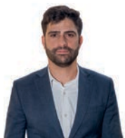
Sergi Perramon Subirana Front Nacional de Catalunya

L'okupació d'habitatges a Catalunya reflecteix una pèrdua de respecte per la propietat, un valor fonamental per a la nostra convivència. Quan algú ocupa un habitatge il·legalment, no només vulnera els drets del propietari, sinó que posa en perill la seguretat i cohesió de la comunitat. Les persones grans, un dels col·lectius més vulnerables, veuen com els seus barris es transformen en zones d'insseguretat i deteriorament, afectant la seva qualitat de vida i salut mental. Un dels efectes més greus de l'okupació és la manipulació il·legal de subministraments elèctrics, coneguda com la "punxada" de la llum. Aquesta pràctica, perillosa i fraudulenta, incrementa el risc d'incendis, atès que les connexions no compleixen els requisits