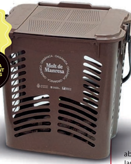
L'Ateneu Les Bases té la segona màquina expenedora de bosses compostables de Manresa