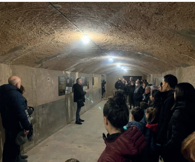
El 19 de gener es van fer visites a l'antic refugi amb els accessos ja renovats