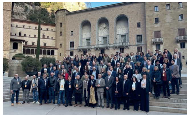
A la dreta, els participants en la trobada fundacional de l'associació a Montserrat