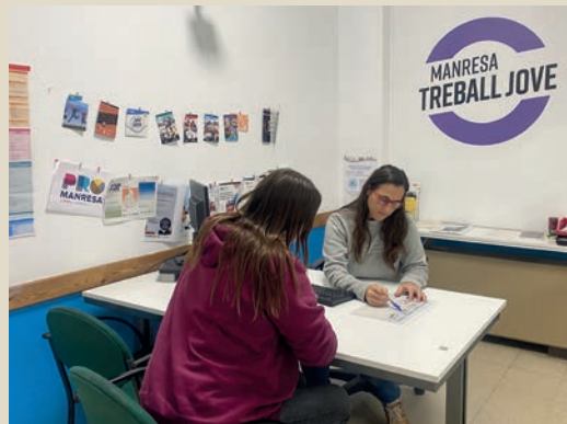
Un servei municipal que orienta els joves en matèria d'ocupació

forma separada ProManresa i el programa municipal de Joventut. Durant l'any passat, Manresa Treball Jove va atendre personalment 472 joves, dels quals 134 van trobar feina.