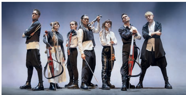
El Kursaal acollirà el concert 'e-Strings' i l'obra 'Dones de Ràdio'

Les entrades es poden comprar a www.kursaal.cat i a les taquilles del teatre els matins de dilluns a dissabte d'11 a 13 h i les tardes de dimarts dissabte, de 18 a 20 h.