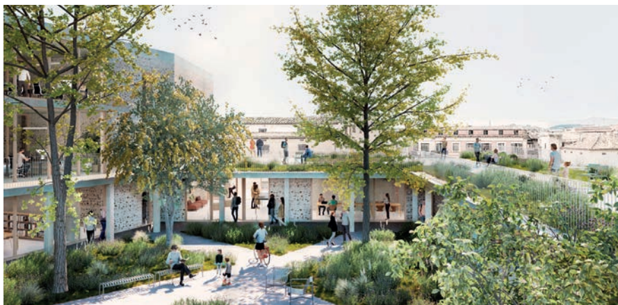
Simulació de com serà el nou edifici que acollirà l'Arxiu Comarcal del Bages i l'Arxiu de Manresa

ta preveu un edifici en forma d'U amb façanes als carrers Vallfonollosa, Na Bastardes i la Baixada dels Jueus, amb cinc nivells construïts a partir del carrer Na Bastardes, i una coberta-mirador. També comptarà amb un jardí central delimitat per un porxo i per la paret posterior de la casa consistorial. L'equipament tindrà una superfície construïda de 3.830 m 2 , dels quals 2.400 es destinaran a arxiu, 625 a usos administratius, 488 a aparcament i 312 a espais d'instal·lacions generals. L'edifici també haurà de tenir en compte les restes arqueològiques del call jueu descobertes a finals del 2024.