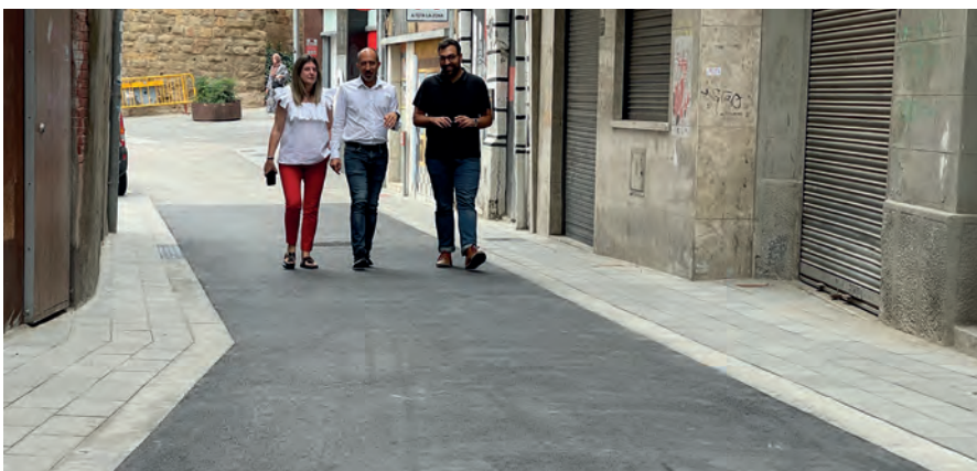
L'alcalde i els regidors de Mobilitat i Via Pública en una visita recent al carrer Sant Andreu

Una vegada finalitzades les obres per ampliar la vorera de la Carretera del Pont de Vilomara, la mobilitat del barri quedarà de la següent manera: la Carretera del Pont de Vilomara passarà a ser només de sentit ascendent, amb dos carrils, fins al carrer Sant Blai, i el carrer Sant Cristòfol passarà a ser només de sentit descendent, també amb dos carrils. Pel que fa al carrer Viladordis, tindrà doble sentit de circulació en el tram que uneix els dos carrers. També hi haurà canvis a la línia L8 del bus urbà, que modificarà el recorregut i passarà per la Carretera del Pont de Vilomara i el carrer Sant Blai fins al carrer Joan Fuster, tal com fa la línia L1. Com a conseqüència, s'eliminaran les parades de bus de Gaudí, Mercat Sagrada Família i Escola Ítaca, que se substituiran per les parades del CAP Foneria, Roger de Flor i la de l'Espai Jove Joan Amades.