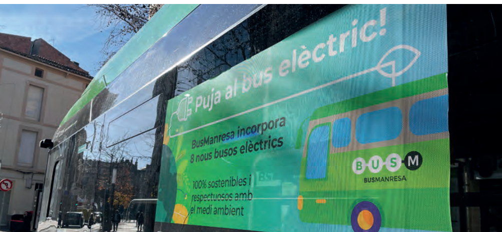
El foment del transport públic és una de les bases per a la construcció d'una ciutat sostenible

El foment del transport públic és una de les bases de la Manresa sostenible. Com a actuacions recents en aquest sentit, cal destacar l'electrificació de la flota d'autobusos, la posada en marxa l'any passat de la T-Jove 18 i les bonificacions al transport públic del govern estatal, que han permès aplicar en el darrer any una rebaixa temporal del 50% a la T-10 i a la T-Mes.