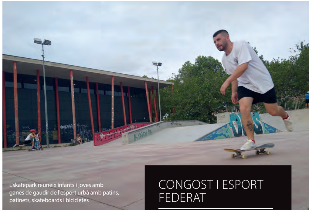
L'skatepark reuneix infants i joves amb ganes de gaudir de l'esport urbà amb patins, patinets, skateboards i bicicletes

Pel que fa a les persones que els agrada caminar, tenen l'opció d'utilitzar el circuit de running, però també els itineraris de l'Anella Verda, ja que n'hi ha dos que hi tenen inici i final. El recorregut M1- El Collbaix és un itinerari de 10,5 quilòmetres que arriba fins al turó que porta aquest nom i té una durada prevista de