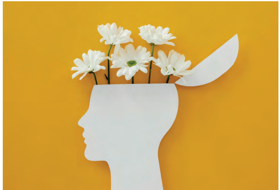
El Dia Mundial de la Salut Mental d'aquest any porta per lema "La salut mental és cosa de tothom"

L'empresa municipal Fòrum SA va obrir a finals de setembre la nova Oficina del Servei d'Estacionament Regulat de Manresa. Aquesta oficina permet oferir una millor atenció a la ciutadania en tots aquells aspectes relacionats amb el servei de la zona blava, i fer-ho a peu de carrer, ja que la nova oficina s'ha ubicat als baixos del carrer Cardenal Lluch número 6, en un local més accessible. Fins ara, l'oficina estava situada en un primer pis, al carrer de l'Era del Firmat. L'horari d'obertura de l'oficina és de dilluns a dijous de 9 a 13.30 hores i de 16 a 18 hores i divendres de 9 a 13.30 hores. Per incidències o consultes, també hi ha el telèfon d'atenció al públic 900 901 560.