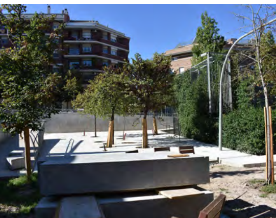
Canvi d'aspecte del Parc Vila Closes

El preu d'adjudicació de l'encàrrec és de 223.904,24 euros. La durada de les obres és de cinc mesos. Un cop finalitzin, es farà la instal·lació del mobiliari.