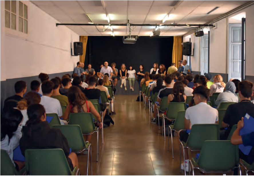
Acte de presentació del nou curs del programa Laboràlia al Casal de les Escodines de Manresa