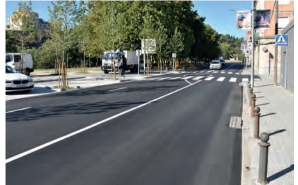
El carrer Francesc Moragas i el Passeig del Riu amb paviment i senyalització renovats