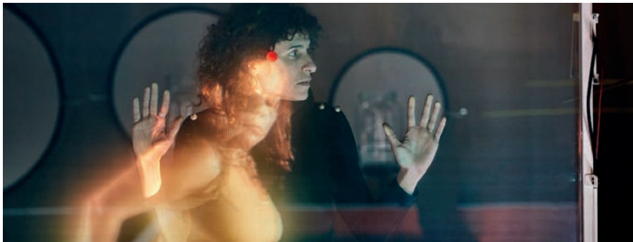
'Dimonis' és el segon muntatge de la trilogia que Cabosanroque dedica a autors catalans

'Dimonis', el segon muntatge que Cabosanroque dedica a autors catalans, forma part del programa d'exposicions itinerants que el Departament de Cultura de la Generalitat coordina amb l'Ajuntament de Manresa per apropar l'art contemporani a tothom.