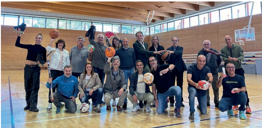
L'alcalde i el regidor d'Esports van presentar la candidatura amb representants d'entitats esportives

Els dies 13, 14 i 15 de novembre la ciutat rebrà els comissaris d'Aces Europe, que avaluaran la proposta de Manresa.