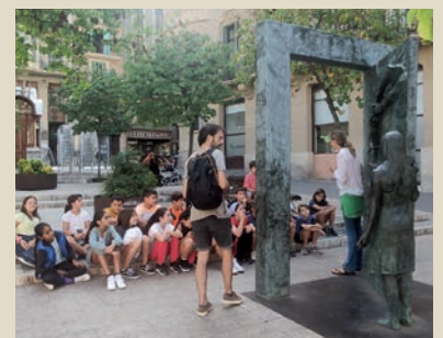
La Casa Flors Sirera és un espai per crear xarxa i formar-se en cultura de la pau