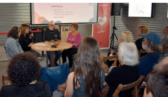
Presentació de l'oficina d'atenció al col·lectiu

Sumant-se als homenatges, el barri de les Escodines lluirà ben aviat un mural dedicat a les persones grans, una iniciativa de l'Associació de Veïns i Veïnes de les Escodines, del consistori i de la Fundació Germà Tomàs Canet. Dissenyat per Txema Rico, estarà situat a l'exterior de la Llar Sant Joan de Déu i tindrà 8 metres quadrats de superfície.