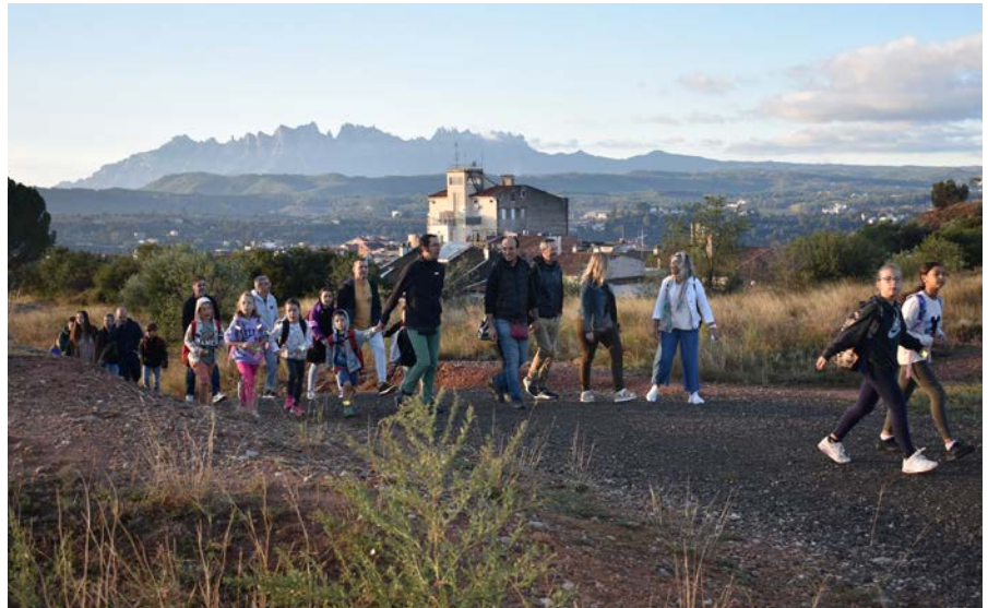
Desenes d'alumnes, mares i pares i professorat van participar en la caminada fins a l'escola

L'Ajuntament de Manresa va distribuir a l'octubre kits de benvinguda als estudiants dels primers cursos d'UManresa i la UPC Manresa, amb l'objectiu que coneguin la ciutat, el seu patrimoni i els diferents serveis de què poden gaudir. El paquet estava format per una bossa, una ampolla amb el lema "Manresa Campus Universitari", un plànol de la ciutat i un díptic informatiu sobre els diferents serveis que ofereix l'Ajuntament de Manresa i altres institucions per facilitar l'arribada i l'establiment dels estudiants a la ciutat. El fullletó aportava informació sobre aspectes de mobilitat, turisme, cultura,