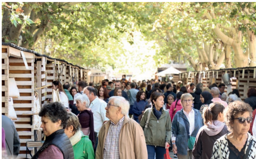
La fira-mercat d'Ecoviure al Passeig Pere III va rebre la visita d'unes 13.000 persones