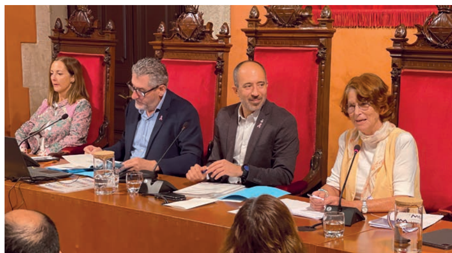
La Síndica de Greuges va intervenir a la sessió plenària per exposar l'informe anual del 2022

Durant el Ple d'octubre, també es van aprovar els projectes de rehabilitació de les façanes i cobertes de la Fàbrica Nova i dels sostres de la Fàbrica dels Panyos, entre altres qüestions.