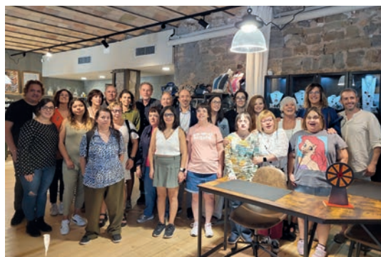
La inauguració va reunir representants de totes les parts implicades en la posada en marxa del viver

Amb el nou viver, el consistori vol fomentar l'emprenedoria artesanal, la visualització de nous projectes i apuntalar