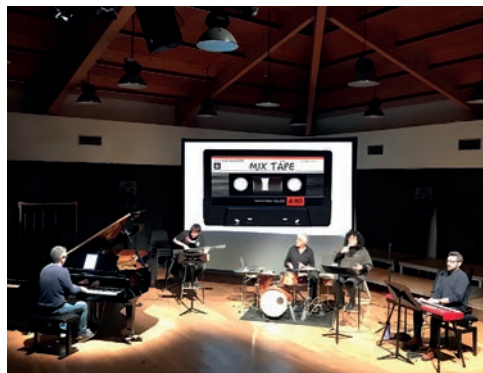
La 14a edició del cicle "Una hora de música al Conservatori" aposta per la varietat d'estils