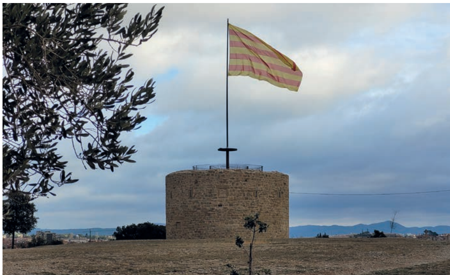
La torre s'ha convertit en un mirador des d'on es pot gaudir d'unes magnífiques vistes de la ciutat