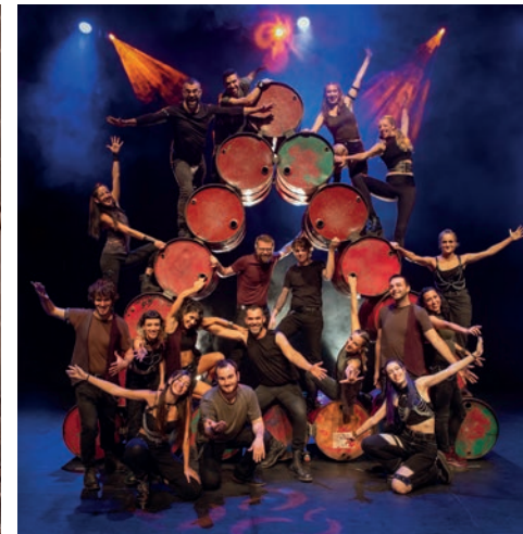
L'espectacle barrejarà sonoritats provinents de la cobla La Principal de la Bisbal i de Fun Dan Mondays