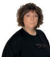
Inmaculada Cervilla Galera Vox

Nos están asfixiando económica y energéticamente con el gran timo de la Agenda 2030 y sus delirios climáticos. Soportamos las consecuencias con cada vez más restricciones, exigencias e imposiciones. Están empobreciendo a marchas forzadas a la clase media trabajadora y haciéndonos, cada día que pasa, más dependientes de terceros países, robándonos nuestra soberanía, nuestro bienestar y nuestra prosperidad.