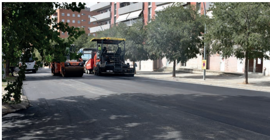
En els darrers 8 anys, s'han invertit prop de 8 milions d'euros en millores de l'espai públic

es pavimentaran 13 carrers, amb una inversió de 350.000 euros. Les obres es faran a l'estiu per minimitzar les molèsties a la ciutadania i afectar el mínim possible l'inici del curs escolar. Els espais on s'actuarà són els carrers Àlvar Aalto, Amat i Piniella, Bases de Manresa, Ferrer