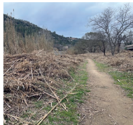
La intervenció es fa al llarg de 3 quilòmetres

tipus de planta (boga, canyís i salicària), que a partir d'ara acompanyaran les espècies autòctones que encara resistien a la zona, com els àlbers i els freixes. Les plantacions es faran molt properes a l'aigua per assegurar-ne la pervivència. L'objectiu del projecte és recuperar el bosc de ribera propi del riu Cardener, que és molt dinàmic i que s'espera que es pugui anar reproduint al llarg de la següent dècada.