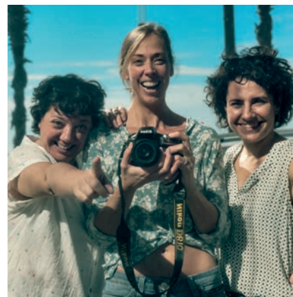
'Austràlia', una comèdia sobre vincles familiars

l'objectiu de no tenir cap butaca buida. Amb aquesta campanya, enguany es donarà el tret de sortida al Dia Mundial del Teatre, que se celebra el 27 de març.