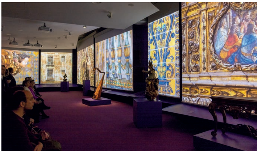
La sala "Escenaris del Barroc" es transforma en un espai immersiu amb vuit pantalles gegants

Les persones interessades a visitar el Museu del Barroc poden adquirir les entrades a la web www.museudelbarroc.cat i, de forma presencial, a la recepció de l'edifici. L'entrada general val 8 euros i la reduïda, 6. També es fan visites guiades d'una hora de durada els dissabtes a les 16.30 h i els diumenges a les 11 h a un preu de 12 euros l'entrada general i de 9,60 euros, la reduïda. A més a més, hi ha la possibilitat de concertar visites guiades per a grups i escoles. L'entrada serà gratuïta el primer diumenge de cada mes i en dates assenyalades com la Festa Major i la Festa de la Llum.