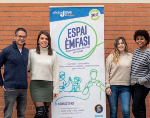
L'equip de professionals atén de forma individualitzada i prepara tallers i activitats grupals

A més a més del servei de psicologia individualitzat per a joves i famílies, Es-