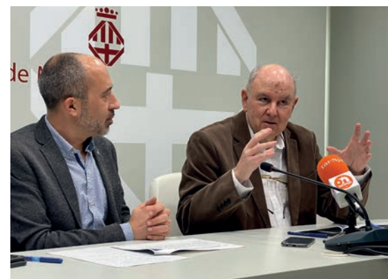
Roda de premsa de presentació del protocol

Manresa s'ha convertit en el primer municipi català en disposar d'un protocol que permet abordar els tres àmbits en conjunt.