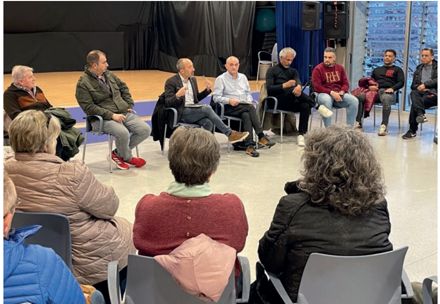
Reunió de l'alcalde amb el veïnat del barri de la Font dels Capellans

L'Ajuntament de Manresa ha dut a terme durant el mes de febrer treballs per la millora de la seguretat viària a diversos camins escolars de la ciutat. Els treballs es van executar a la carretera de Santpedor, al tram entre els carrers Enric Morera i Bernat de Cabrera (itinerari escolar de l'Institut Pius Font i Quer, Escola La Sèquia, Escola Vedruna i La Salle); a l'accés de l'escola Sant Ignasi, al carrer Mestre Albagés; al Camí Escolar de l'Institut Guillem Catà, escoles Espill i El Pilar, a l'avinguda dels Països Catalans; i al Camí Escolar del carrer de la Pau, al tram entre els carrers Zamenhof i Amadeu Vives (itinerari escolar de l'Institut Pius Font i Quer, Escola La Sèquia, Escola Vedruna i La Salle). Amb les actuacions s'ha millorat la visibilitat i la seguretat dels passos de vianants i de les cruïlles amb la creació de nous passos de vianants o repintant-ne d'existents, l'ampliació dels itineraris a peu, la instal·lació de noves senyalitzacions verticals i horitzontals i la instal·lació de pilones, entre altres accions.