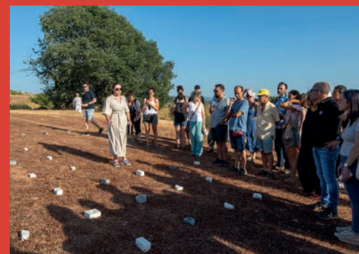
L'Anella Verda de Manresa és l'entorn que acull el festival Microscopies