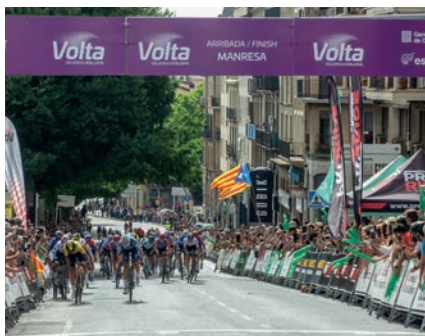
Volta ciclista a Catalunya femenina a Manresa

Sota el paraigua de Manresa Ciutat Europea de l'Esport 2024, la ciutat va acollir durant el mes de juny tot un seguit de campionats que van omplir d'activitat l'agenda esportiva. Entre les competicions celebrades, cal destacar la primera Volta ciclista a Catalunya femenina que, amb sortida i arribada a plaça Infants de Manresa, va atreure nombrós públic a la ciutat.