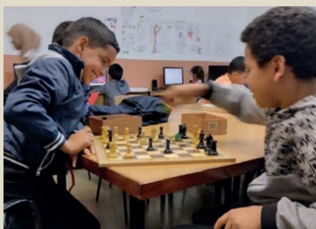
Els infants poden participar en activitats com la de Contes per fer-se gran i jocs de taula

tan gestionades per la Federació d'Associacions de Veïns de Manresa (FAVM), mentre que l'Associació de Veïns i Veïnes de la Font dels Capellans i la de les Escodines gestionen les dels seus respectius barris. La implicació de les entitats veïnals en aquest servei municipal és clau per afeblir els riscos d'exclusió social dels col·lectius potencialment vulnerables, com ara infants, nova ciutadania i gent gran, ja que des de la