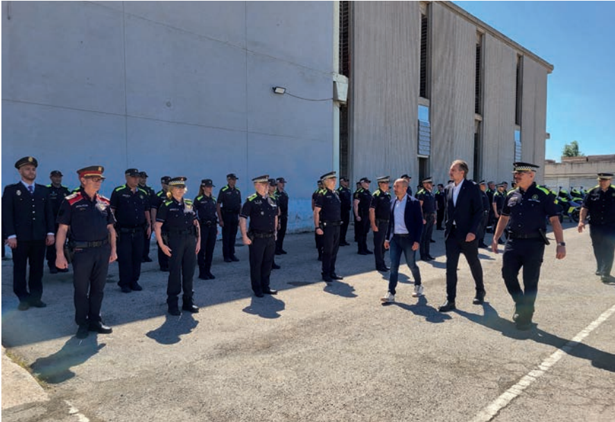
Durant l'acte es van distingir, entre agents de diferents cossos policials i ciutadans, 35 persones