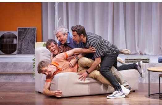
Escena d'"El favor", de Susanna Garachana

La nova temporada del Kursaal continuarà amb la gala inaugural del Festival de Circ (5 de setembre) i el monòleg "Ante todo mucha calma" de José Corbacho (8 de setembre).