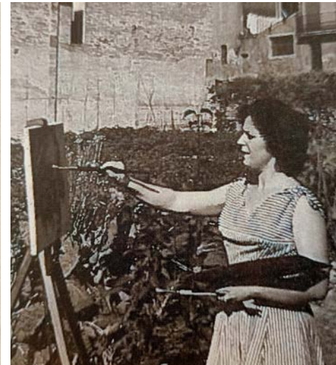
L'exposició identifica i visibilitza les dones artistes de Manresa nascudes abans de la Guerra Civil