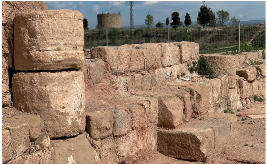
El jaciment de Santa Caterina està situat a 400 metres a l'oest de la Torre

L'empresa municipal Aigües de Manresa destinarà més de 800.000 euros per millorar aquest estiu la xarxa d'aigua i clavegueram de la ciutat. En total es faran 19 actuacions amb la previsió d'acabar-les a finals d'octubre. D'aquests treballs, 7 estan vinculats a l'asfaltatge de carrers emmarcats en el Pla Millora de l'Espai Públic 2024. Les actuacions afectaran la mobilitat de persones i vehicles en el moment que s'estigui treballant a cada punt d'intervenció que són: la carretera de Cardona, els carrers Viladordis, Providència i la plaça Pare Oriol, plaça Catalunya, els carrers Dibuijant Vilanova, Martí i Pol, Amat Piniella, Berga, Passeig Pere III, carretera del Pont de Vilomara i el passatge Pujada Roja. També s'intervindrà als carrers Sant Llàtzer, Sant Jaume, Sant Magí, Roger de Flor i Sant Maurici.