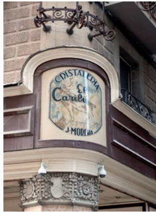
Les ajudes són per restaurar elements patrimonials protegits

i per a millores en comerços protegits i que contribueixin a garantir-ne la continuïtat.