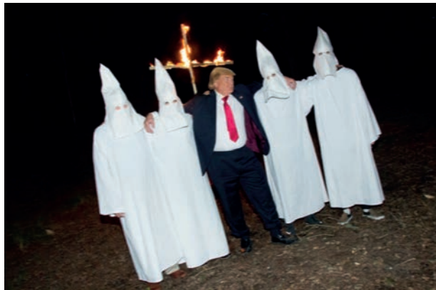
L'artista localitza dobles de personatges famosos per poder recrear escenes imaginàries