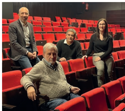
Representants de l'Ajuntament i el Kursaal van presentar els bons resultats al teatre

tes del Servei Educatiu i l'aposta per un model de gestió únic, participatiu i proper amb el públic, caracteritzen l'equipament, que es compta entre els teatres de referència a escala nacional.