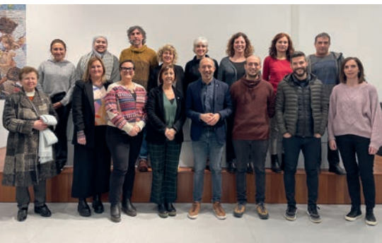
Les mesures s'han treballat conjuntament amb les direccions dels centres, assessors i personal tècnic

Per tal de fer arribar aquestes novetats a les famílies, l'Ajuntament de Manresa ha previst una campanya informativa amb xerrades, fulletons i jornades de portes obertes. També preveu acompanyar les famílies en el procés d'escolarització a través de personal tècnic que faciliti la preinscripció i matrícula.