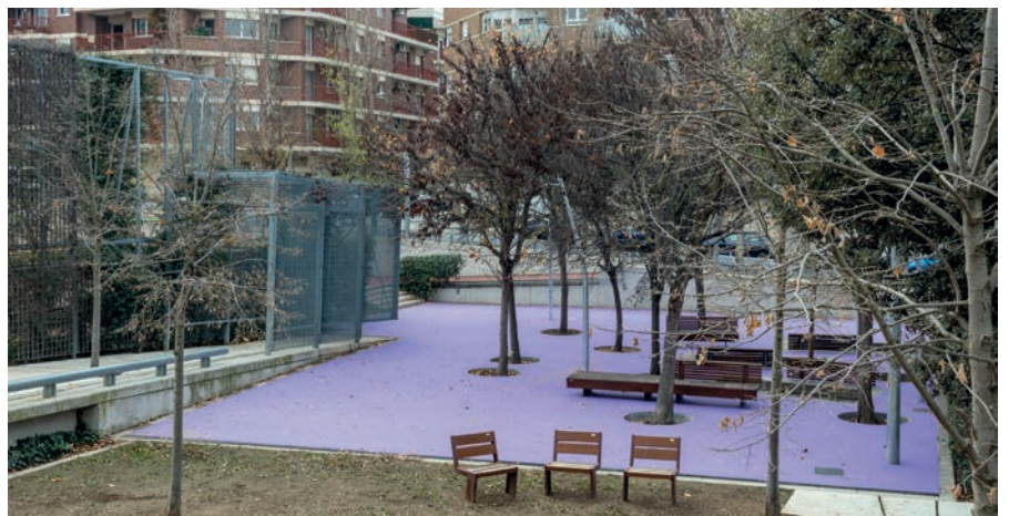
El nou paviment està pensat per aguantar millor l'expansió de les arrels dels arbres

finalitat que aquest material tingui un millor comportament davant l'acció de les arrels dels arbres. Per tal de guanyar verdor, també s'han fet noves zones de gespa als espais on hi havia hagut llambordes, i que havien esdevingut sorrals, i s'han plantat una vintena d'arbres. Així mateix, i per procurar-ne un bon manteniment, s'ha instal·lat un sistema de reg nou. També s'ha millorat el mobiliari que estava en mal estat i s'han instal·lat dos aparells biosaludables. L'actuació ha afectat una superfície de 2.461,70 metres quadrats.