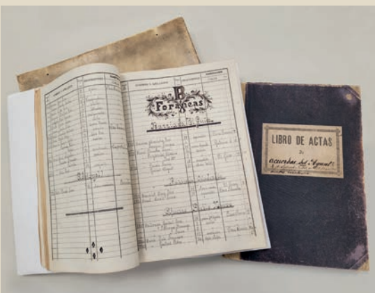
L'arxiu compta amb 1.000 metres lineals de documentació que es pot consultar

nístics (1940-2010), a més a més de plànols i fotografies aèries de la ciutat i entorn. A l'Arxiu Municipal també hi ha documentació molt variada generada pels Ajuntaments com ara documents sobre la història de Manresa, fulletons d'actes, cartells, programes de festes i revistes, entre altres.