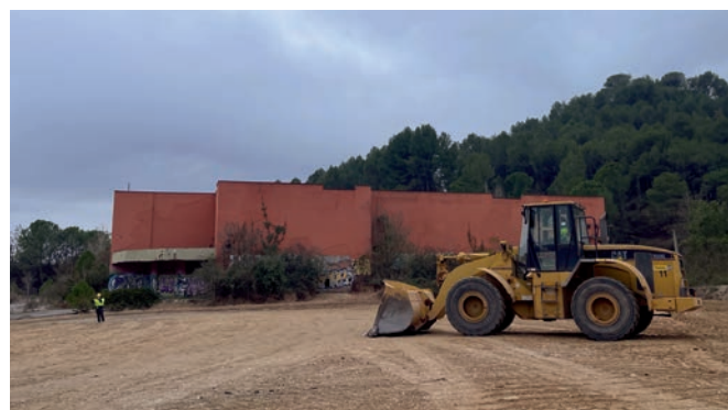
Un cop llaurada la terra de l'aparcament es deixarà que la natura segueixi el seu curs