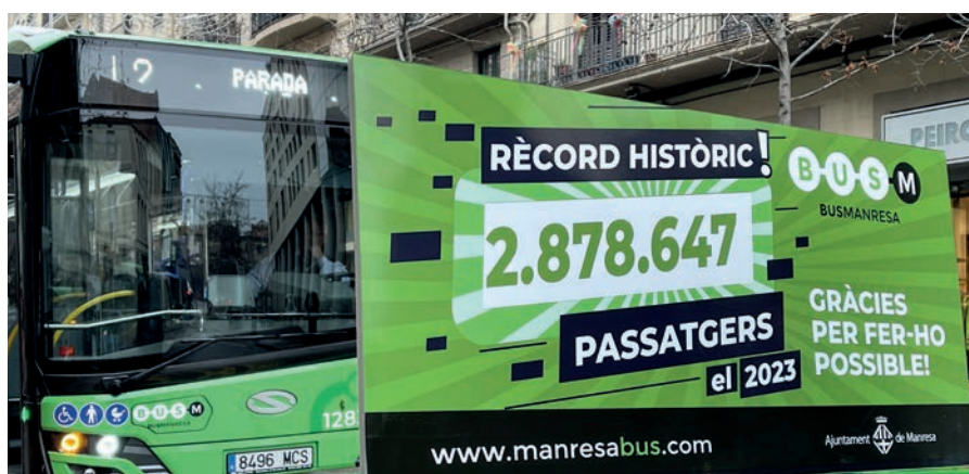
L'objectiu del consistori és arribar als 3 milions de viatgers en un any

Els joves que aquest any compleixen els 17 o 18 anys ja poden sol·licitar la T-Jove 18 que els permet fer viatges il·limitats i gratuïts. L'objectiu d'aquest títol és que, un cop esgotada la targeta T-16 de la Generalitat, puguin continuar gaudint del transport públic per moure's per la ciutat. La targeta es pot sol·licitar a través de la web de l'Ajuntament, a l'Espai Jove Joan Amades (carrer Sant Blai 14) i a l'Oficina d'Atenció a la Ciutadania (OAC), a la plaça Major 1. La targeta es rep al domicili on s'estigui empadronat. Cal pagar una única taxa de 6,45 euros.