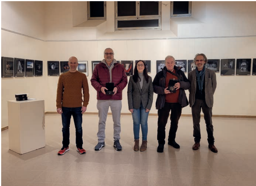
Moment del lliurament de premis de fotografia Memorial Modest Francisco al Casino