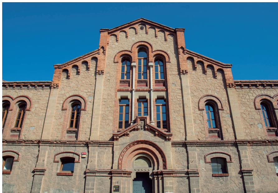
La subvenció per a l'Edifici Infants és de més de 130.000 euros i anirà destinada a millores estructurals

L'Ajuntament de Manresa ha impulsat la creació d'un catàleg de moda sostenible, en un projecte on participen diferents iniciatives tèxtils i entitats socials de la ciutat. La iniciativa s'emmarca en la Festa del Riu, que se celebra anualment el mes de maig amb l'objectiu de difondre formes de vida sostenibles, ecològiques, inclusives, justes i solidàries. Amb el catàleg de moda sostenible, que es podrà consultar a partir de la primavera, l'Ajuntament vol donar visibilitat i promocionar les alternatives econòmiques de proximitat, i amb un impacte global positiu, tot connectant projectes en el camp del tèxtil responsable amb entitats d'inclusió social.