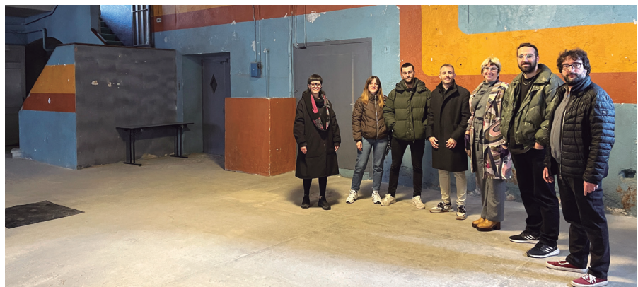
Presentació dels futurs espais de L'Anònima destinats a activitats culturals

L'edifici, declarat Bé Cultural d'Interès Local, es rehabilitarà amb fons Next Generation i acollirà també la nova Agència de Desenvolupament Local ProManresa.