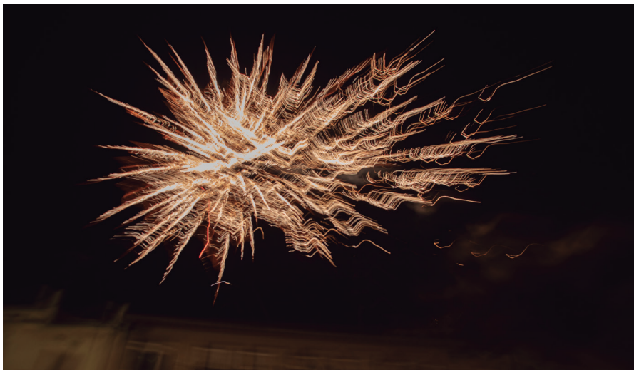
Castell de focs de l'espectacle inaugural de Manresa 2022, fa un any

Un cop tancat l'Any de Celebració, el projecte Manresa 2022, enfocat a potenciar la ciutat com a destinació turística, continuarà el seu camí, mantenint actes que s'han anat consolidant en la programació cultural i que estan pensats per potenciar la petjada ignasiana que guarda la ciutat, com les Jornades Gastronòmiques del Camí Ignasià, el cicle de músiques Sons del Camí o la Marxa del Pelegrí. Així mateix, es continua treballant en la potenciació del Camí Ignasià, conjuntament amb les altres comunitats per on passa, tenint sempre en compte que Manresa és el final d'aquest camí, i on el visitant pot descobrir el patrimoni ignasià tot fent estada a la ciutat.