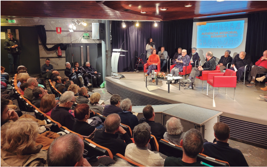
L'Audiència Memorial, la primera que es feia a Manresa, va omplir l'Auditori de la Plana de l'Om