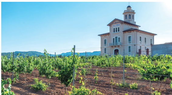
La rehabilitació de la Torre Lluvià és un dels projectes que es finançaran amb els fons europeus

En el cas de L'Anònima, les obres comptaran amb 2,8 milions d'euros dels Next Generation, atorgats a Manresa en el programa de rehabilitació d'edificis públics. Després de les obres, L'Anònima acollirà la seu de ProManresa i activitat cultural. Pel que fa a la Torre Lluvià, els treballs se centraran en els acabats interiors i les instal·lacions, després que el 2015 es completés la primera fase de la rehabilitació. Les obres rebran 815.000 euros dels fons Next Generation. Quant al nou camí, la proposta, que esdevindrà un mirador paisatgístic, es va consensuar el 2018 amb veïns i entitats, i ha rebut 350.000 euros dels fons europeus.