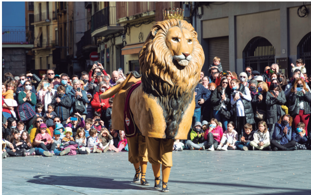
La ballada de la imatgeria manresana es farà el 21 de febrer al migdia

El 20 de febrer, a les 19.30 h, hi haurà l'Encesa de la Nova Llum a Sant Domènec i, a les 20 h, a la plaça Infants, es farà l'espectacle de teatre i dansa que representa el Pacte de la Concòrdia, que enguany es potencia i se'n renova el guió. També hi haurà l'arribada de la Llum i l'Aigua al Monument de la Llum. El dia 21, l'exhibició dels Tirallongues, la tronada i la ballada de la imatgeria manresana protagonitzaran els actes tradicionals.