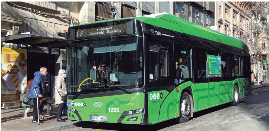
Un dels nous busos elèctrics a la parada d'Àngel Guimerà

El bus de Manresa va recuperar el 2022 les xifres d'abans de la pandèmia Així, va tancar l'any amb 2.168.737 usuaris, a només 49.884 usuaris (un 2%) dels 2.218.621 que es van registrar el 2019, el darrer any sencer abans de la Covid, i a 77.820 dels 2.246.557 usuaris registrats el 2008, any que manté el rècord històric.