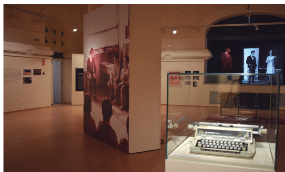
L'exposició al Centre Cultural El Casino es pot visitar fins al 5 de març