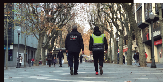
Una patrulla mixta de la Policia Local i dels Mossos d'Esquadra, al Passeig Pere III.

La darrera reunió de la Taula per la Seguretat, el Civisme i la Convivència de Manresa, que reuneix, entre d'altres, tots els cossos policials, va constatar durant el 2022 una caiguda del 30% en els robatoris en domicilis respecte el 2019 (el darrer any pre-pandèmia), un manteniment en nivells molt baixos dels robatoris amb violència i intimidació i la desaparició de fets que havien creat molta preocupació, com ara baralles amb armes blanques al carrer. Mesures com les patrulles conjuntes entre Policia Local i Mossos d'Esquadra o la instal·lació de càmeres de videovigilància expliquen aquest descens general de les dades de delinqüència al carrer.