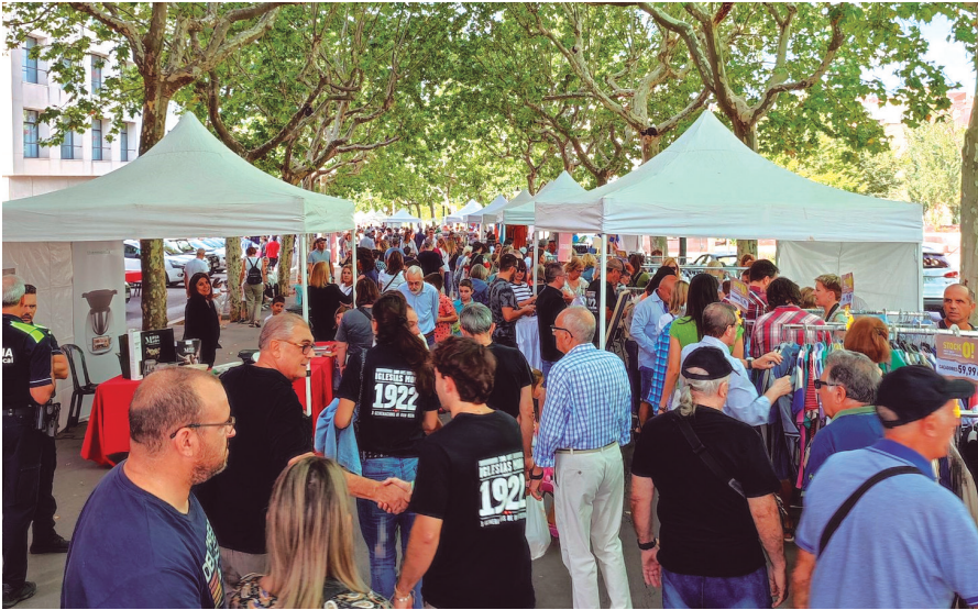
Visitants a les Fires de Setembre, al Passeig Pere III, que va unir la Fira Setembre i la FiraStiu