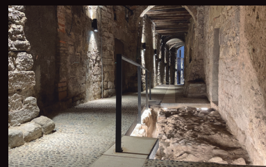
El Carrer del Balç, atractiu patrimonial

El Centre Històric de Manresa està integrat pel Barri Antic, la part antiga de Les Escodines i una part de Vic-Remei, tres barris amb característiques comunes