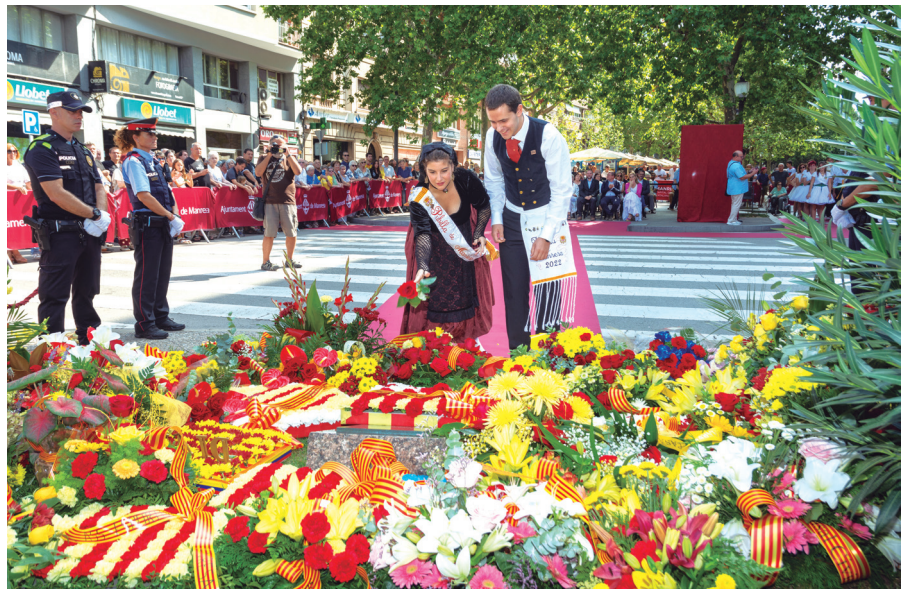
La Pubilla i l'Hereu de Manresa van participar en l'ofrena de l'acte institucional de la Diada Nacional