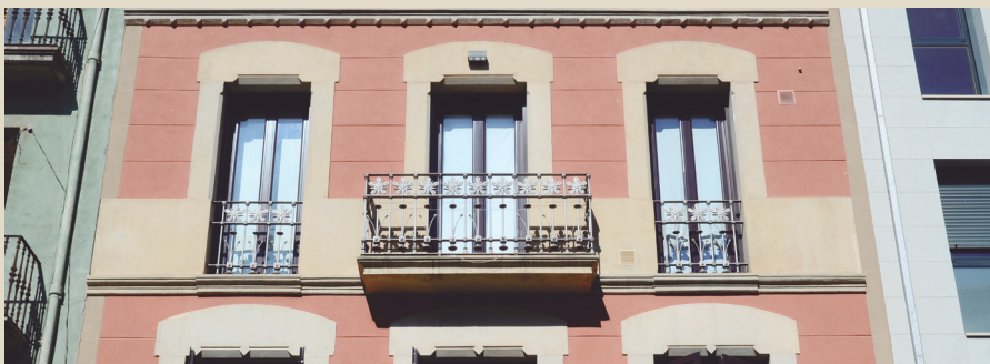
Habitatges rehabilitats al centre de Manresa

crèdits, subvencions del programa d'instal·lació d'ascensors al Centre Històric, ajuts del Programa de Masoveria Urbana... i informa dels ajuts a fons perdut per obtenir la cèdula d'habitabilitat i de les subvencions del programa per rehabilitar habitatges privats a canvi del seu destí social, que es gestionen des de