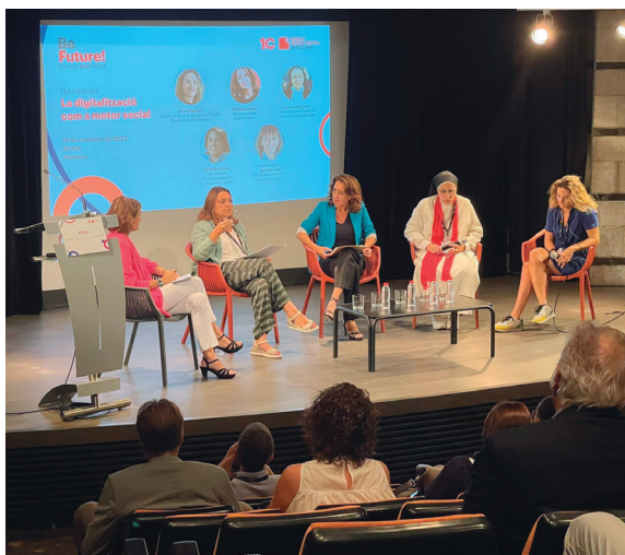
La jornada BeFuture, organitzada per Mobile World Capital, es va fer a l'Espai Plana de l'Om

Manresa va acollir el 15 de setembre la jornada BeFuture, que va debatre la millora del territori a través de la digitalització i l'aposta per les noves tecnologies. Es tracta d'una iniciativa de Mobile World Capital Barcelona amb l'objectiu de potenciar la tecnologia i la transformació digital de les ciutats. Durant l'acte, es va fer una marató de programació en la qual 40 joves manresans van plantejar solucions a un reptes social.